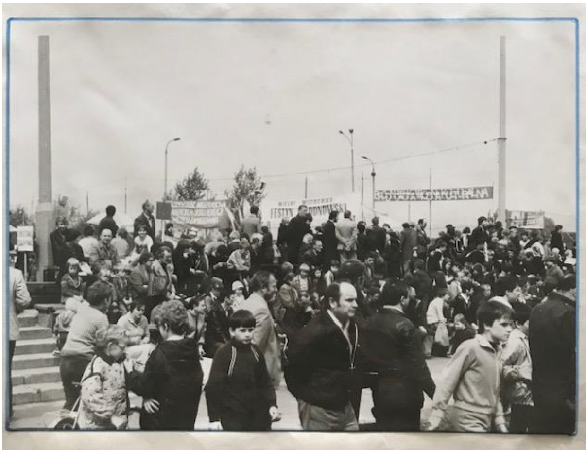
- Premiera przedstawienia pt. „Przygody Plastusia” (w ramach „Bródnowskiej Wiosny Kulturalnej” klubowy teatrzyk wystąpił z nowym przedstawieniem dla maluchów z Osiedla „Wysockiego” - V.1983r.,