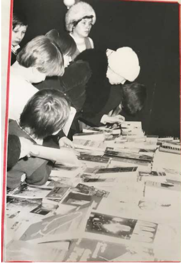
„KIERMASZ KSIĄŻKI” 07.II.1981 r