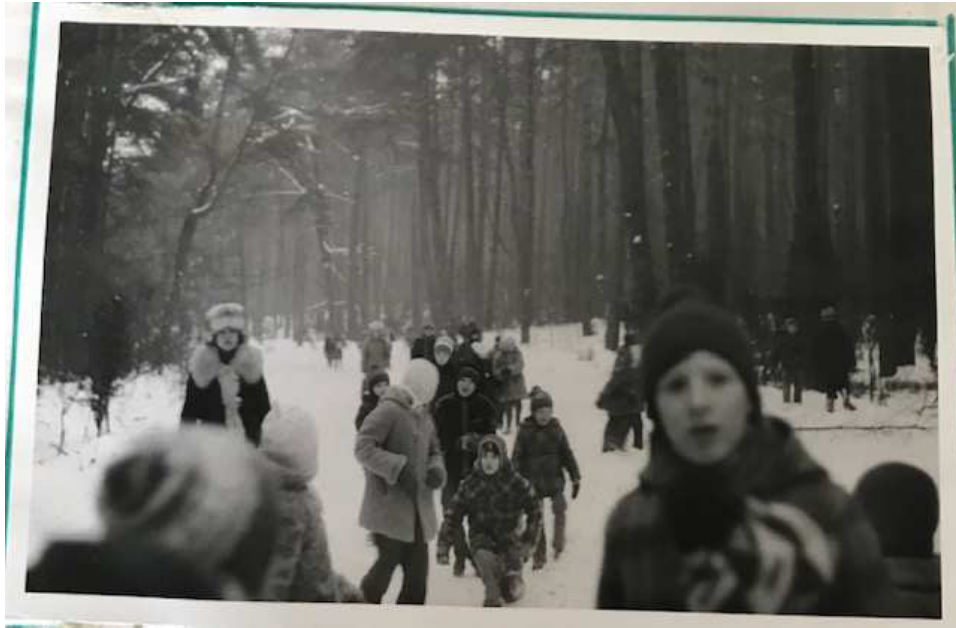
PIESZA WYCIECZKA DO CHOSZCZÓWKI III 1981 r